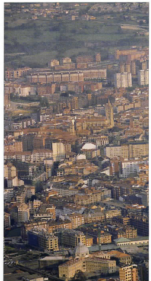
Oviedo et au loin sa cathédrale San Salvador, édifice caractéristique du gothique flamboyant.