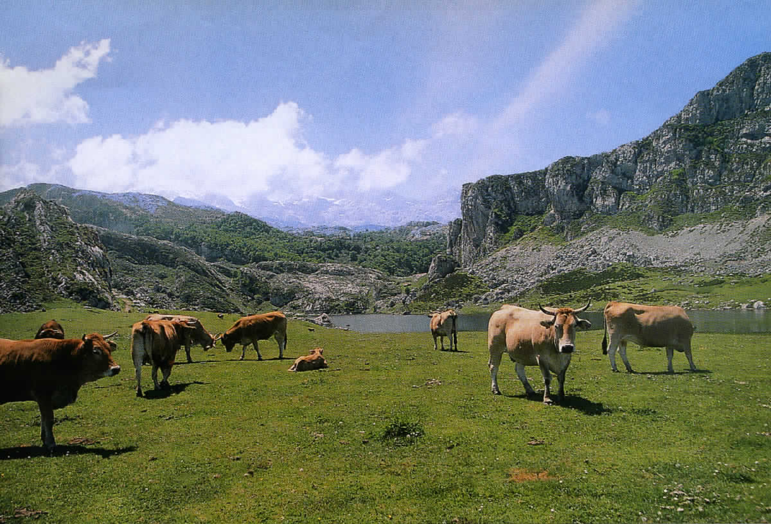
Au-delà du belvédère de la Reina: vue pittoresque sur la sierra de Covalierda. La route conduit au lac de Enol puis à celui de la Ercina.