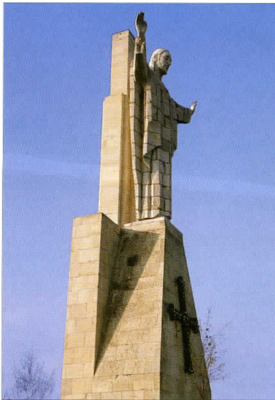
Au Nord-Ouest d'Oviedo, une imposante statue du Christ surplombe la ville. De ce site, s'offre un agréable panorama.

• A Llanes: Hôtel La Posada de Babel. Un lieu raffiné, équipé d'un golf. Tél. : 985.40.25.25. ou www.laposadadebabel.com Restaurant La Cavadonga. Notre table préférée. Un rapport qualité/prix qui défie toute concurrence. Adresse : Manuel Cué 11. Tél. : 985.40.08.91.