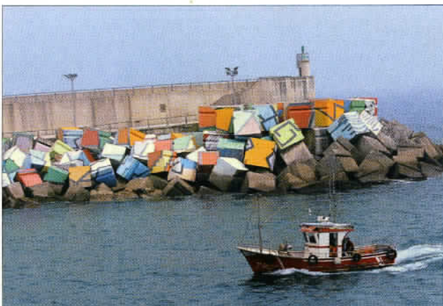
Les blocs de béton de la jetée du port de pêche de Llanes (Cubos de la Memoria) ont été peints par Augustín Ibarrola.