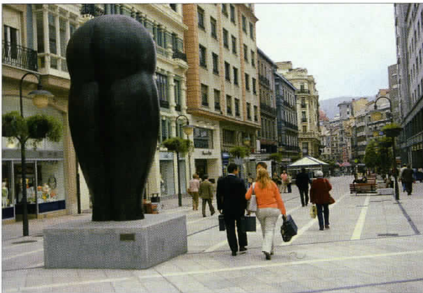
Oviedo, la capitale économique et culturelle des Asturies, possède un centre ancien restauré.